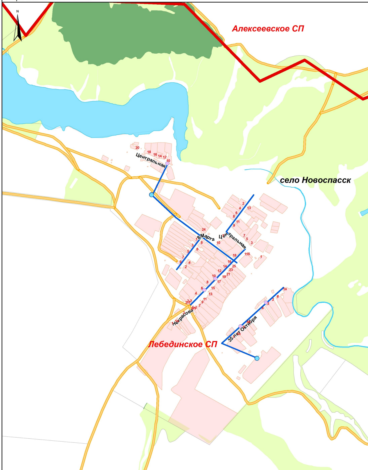
Схема водоснабжения Лебединского сельского поселения Алексеевского муниципального района РТ Фрагмент 3. с. Новоспасск