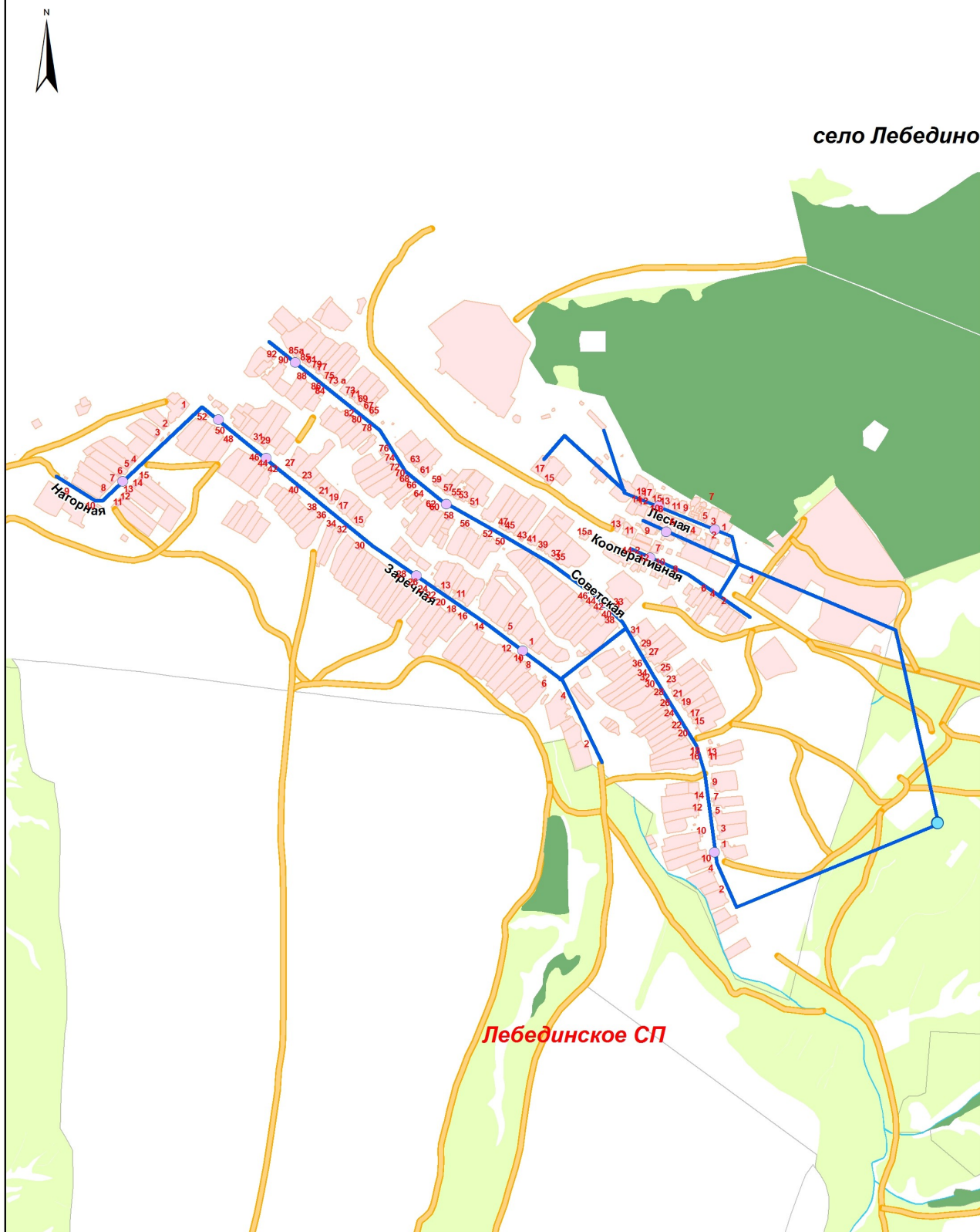
Схема водоснабжения Лебединского сельского поселения Алексеевского муниципального района РТ Фрагмент 1. с. Лебедино